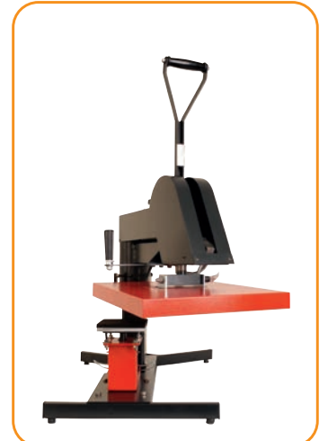
Abb. 2 · Brusttaschen-Druckplatte