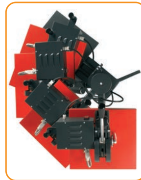
Abb. 4 · Großer Schwenkbereich zur einfachen Textil- und Transferpositionierung