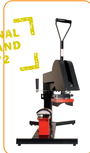
Abb. 1 - optionales Kappenset