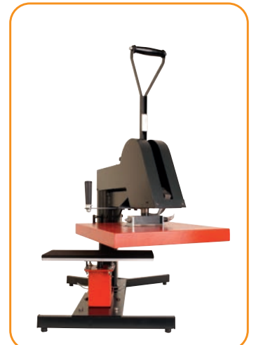
Abb. 3 · Ärmel- oder Hosen-Druckplatte · quer

JETZT NEU! Austausch-Druckplatten 'Girlye' T-Shirts + Schirme