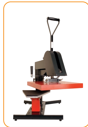
Abb. 6 · Schirm-Druckplatte

Der Transferprozess beginnt mit dem manuellen Herunterziehen des leichtgängigen Druckarms. Der Zeitpunkt des automatischen Entriegelns wird zusätzlich im Digitaldisplay angezeigt.