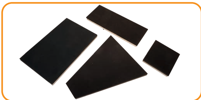
Abb. 3 - Druckplatten in verschiedenen Größen